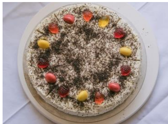
Von Meisterhand gezauberte Torten