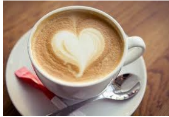
Mit Liebe gebrühter Kaffee